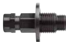
1-hulssav Ø 19-30 mm + 1-hulssav Ø 32-140 mm