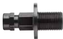
2-hulssav Ø 19-30 mm

Sæt med 3 stk. lange adaptore til hulsave.